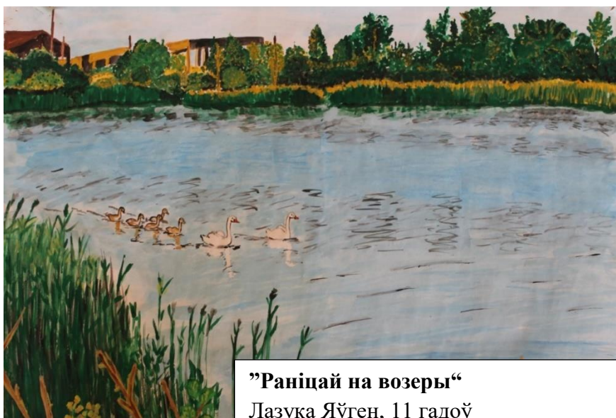
”Раніцай на возеры“