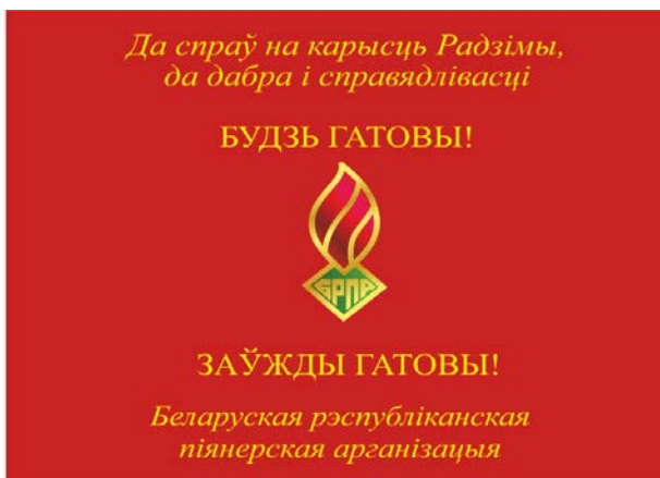
Знамя районной (городской) пионерской организации (лицевая сторона)