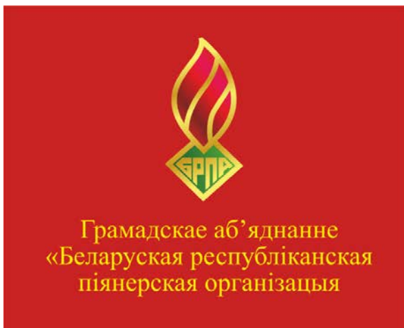
Знамя ОО «БРПО» (лицевая сторона)