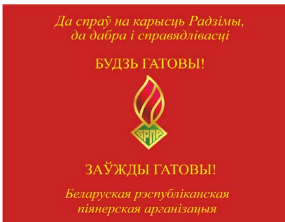
Знамя областной (Минской городской) пионерской организации (лицевая сторона)