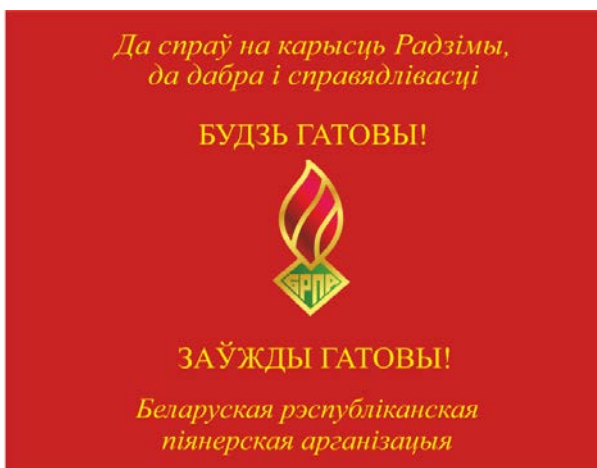
Знамя пионерской дружины (лицевая сторона)