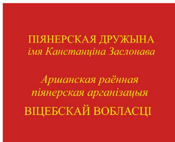
Знамя пионерской дружины (оборотная сторона)