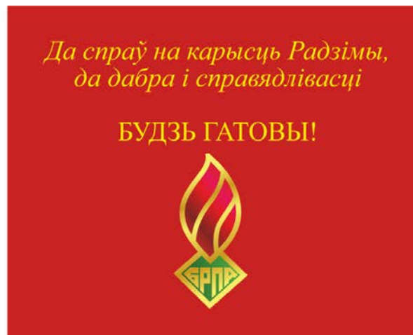
Знамя ОО «БРПО» (оборотная сторона)