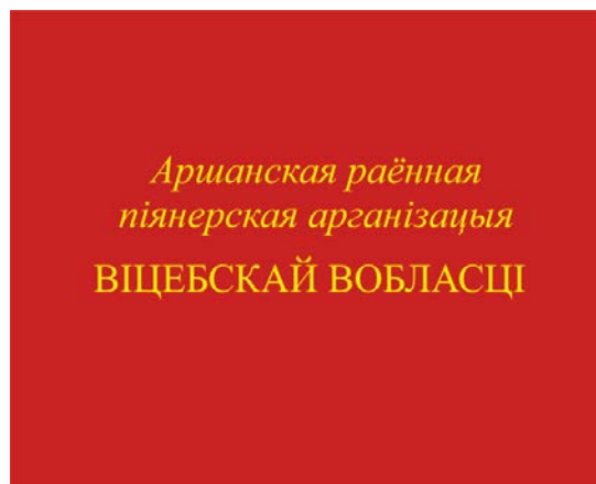
Знамя районной (городской) пионерской организации (оборотная сторона)